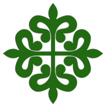
ORDEN MILITAR DE ALCANTARA