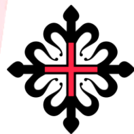
ORDEN MILITAR DE MONTESA