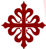
ORDEN MILITAR DE CALATRAVA